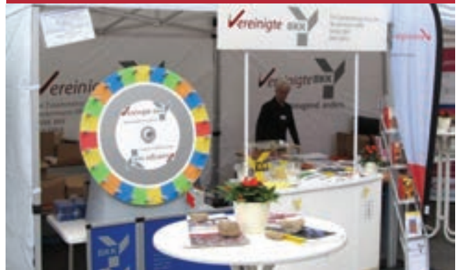
Der neue Stand mit Glücksrad kann sich sehen lassen.